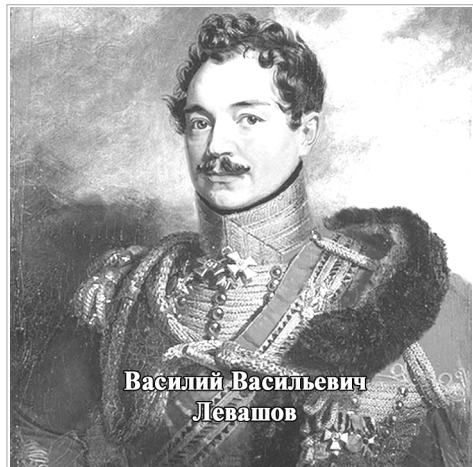
Василий Васильевич Левашов

портретов военачальников, под командованием которых они доблестно сражались в 1812-1814 гг. Конечно же, мы помним далеко не всех из этих трёхсот военачальников. Сегодня многие имена участников тех знаменательных событий уже не на слуху, а то и вовсе позабыты. И наш долг помнить о них, брать пример с достойных сынов Руси, передавать всё, что мы о них знаем новым поколениям русов! Этого в полной мере достоин граф Василий Васильевич Левашов — российский государственный деятель, участник Отечественной войны 1812.